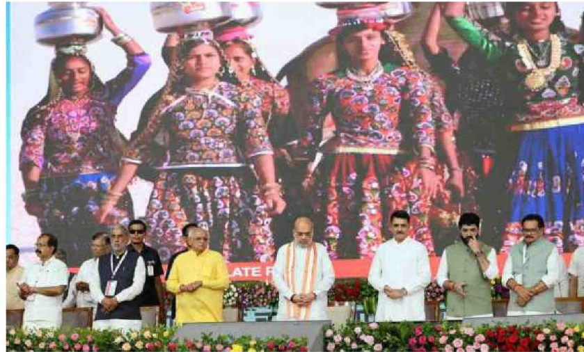
Critical sector: Union Minister Amit Shah, along with Chief Minister Bhupendra Patel, during the fourth foundation day celebrations of the Union Cooperation Ministry in Anand, Gujarat on Sunday.

The Minister outlined an ambitious vision for the sector, citing the govern-