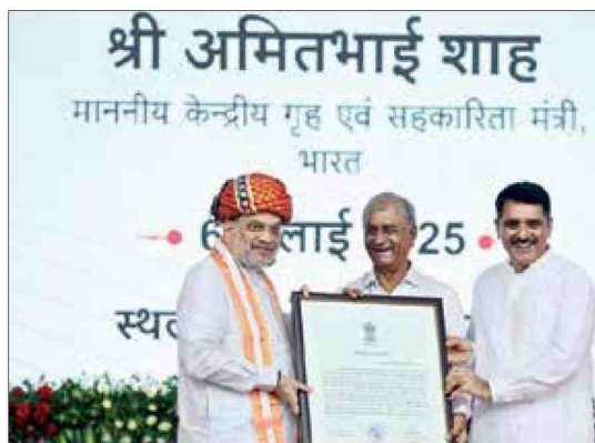
Union Home minister during a function in Gujarat's Anand

Shah inaugurated the newly established multi-state cooperative organisation, the Sardar Patel Cooperative Dairy Federation Limited, and released its official logo.