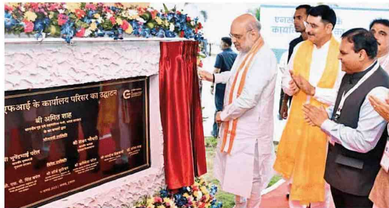
Union home minister Amit Shah inaugurates office building, Maniben Patel Bhawan, in Anand on Sunday

"The entire credit for West Bengal being with India today goes to Syama Prasad and Swami Pranaband," Shah said. "Unhone door dristi ke swath pure Bangal main ek Andolan chalaya, our jis Bang bhang ko Lord Curzon ne kya tha usko rokne keliye pura desh ekatrit hua tha, wohi Bangal ka bibhajan hua aur Paschim Bangal bankar woh aaj Bharat ke saath juda hua hain. Yeh Dr Shyamaprasad Mukherjee ka uplabdhi hain," (He launched a movement across entire Bengal with farsightedness and the