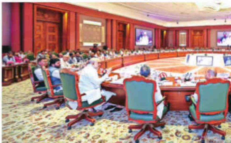
Union Minister Amit Shah chairs a meet on Monday.

"He said that under the National Cooperative Policy, each state's cooperative policy will be formulated according to