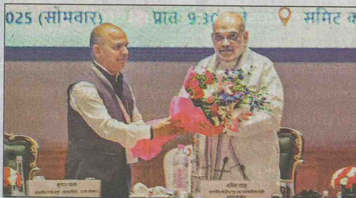
Amit Shah chairs a 'Manthan Baithak' with cooperation ministers of all states and Union territories in New Delhi on Monday

Suggesting that every state announce its cooperative policy before Jan 31, 2026, he said Model National Cooperative Policy Act will bring discipline, innovation and transparency to the cooperative sector across the country.