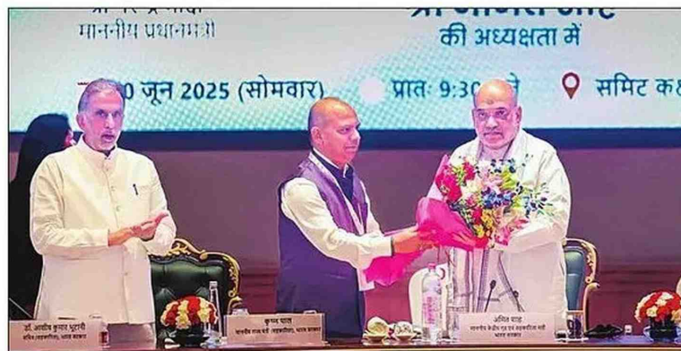
देशभर के सहकारिता मंत्रियों के साथ राष्ट्रीय सहकारिता नीति पर मंथन बैठक में गृह मंत्री शाह।

सहकारिता मंत्रालय की तरफ से आयोजित इस बैठक में शाह ने कहा कि प्रधानमंत्री नरेंद्र मोदी ने देश में पुराने सहकारिता के संस्कार को पुनर्जीवित करने के साथ-साथ नए परिप्रेक्ष्य को ध्यान में रखकर ही सहकारिता मंत्रालय की स्थापना की थी। शाह ने कहा कि मोदी सरकार का लक्ष्य है कि अगले पांच साल में देश में एक भी गांव ऐसा न रहे, जहां एक कोई कोऑपरेटिव न हो और इस लक्ष्य की प्राप्ति के लिए सहकारी डाटाबेस का उपयोग किया जाना चाहिए। शाह ने कहा कि देश में मोदी सरकार आने के बाद ही सामाजिक परिवर्तन का एक नया परिदृश्य सामने आया। पहले भारत में लगभग 60-70 करोड़ लोग ऐसे थे, जिनके पास कई पीढ़ियों तक जीवन जीने की मूलभूत सुविधाएं भी नहीं थीं। 2014 से 2024 तक के कालखंड में ही मोदी सरकार ने करोड़ों लोगों का सपना पूरा कर दिया और इन्हें घर, शौचालय, पीने का पानी, अनाज, स्वास्थ्य, गैस सिलिंडर आदि सुविधाएं मिलने लगीं।