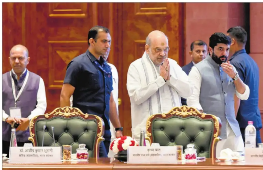
Home Minister Amit Shah at a meeting with state cooperation ministers in New Delhi.

He directed that at least one cooperative training institute from each state should be affiliated with the Tribhuvan Sahkari University and the entire cooperative training system of the state should be