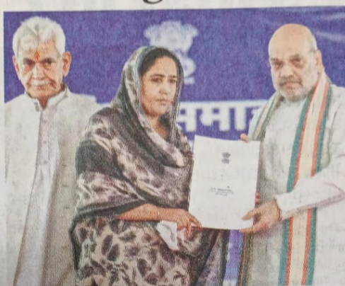
Union Home Minister Amit Shah hands over appointment letters to those who lost their family members in attacks from Pakistan, in Jammu & Kashmir. J&K LG Manoj Sinha is also seen.

Apart from Minister of State for Cooperation Krishan Pal Gurjar and Murlidhar Mohol, officials from the Ministry of Cooperation, Food and