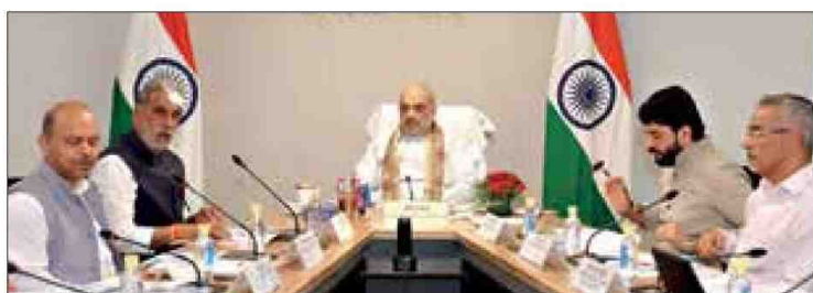
Amit Shah during the meeting on Monday

In his address, Shah highlighted that the cooperative