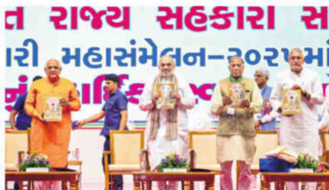
Union minister Amit Shah during the cooperative convention in Ahmedabad

forms with global developments, Shah noted that the country had introduced two core principles – 'Sahkar se Samridhhi' and The Role of Cooperation in Viksit Bharat – as pillars of cooperative renaissance. "Today's conference in Gujarati is a direct outcome of this broader national effort," he said.