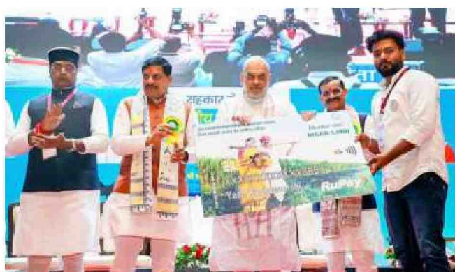
Union Home Minister Amit Shah distributes a Kisan Card to a beneficiary during a conference in Bhopal on Sunday.

“For years, the cooperative movement was moving slowly and turned almost dead. Looking at the cooperative movement nation-