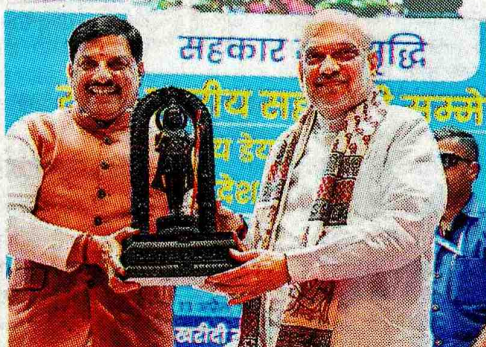
सीएम ने केंद्रीय मंत्री शाह को मोमेंटो भेंट किया।

दूध कलेक्शन 12 लाख से 24 लाख लीटर करेंगे : सीएम लक्ष्य बहुत छोटा, दोबारा सोचो, बड़ा लक्ष्य बनाओ : शाह