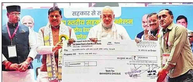
भोपाल में लाभार्थी को प्रतीकात्मक चेक सौंपते सहकारिता मंत्री शाह व सीएम मोहन यादव।

अंतरराष्ट्रीय सहकारी वर्ष 2025 के तहत आयोजित राज्य स्तरीय सहकारिता सम्मेलन में शाह ने कहा, वर्षों तक देश में सहकारिता आंदोलन रेंग रहा था। उन्होंने कहा, आजादी के 75 साल बाद इस आंदोलन को बढ़ावा देने के लिए सहकारिता मंत्रालय का गठन किया गया। पीएम मोदी ने सहकारिता मंत्रालय की स्थापना की और मुझे पहला मंत्री बनाया। इसके बाद आंदोलन ने गति पकड़ी। शाह ने कहा कि केंद्र की पिछली सरकारों ने इस क्षेत्र के उद्धार के लिए विचार तक नहीं किया। विचार होता भी कैसे, कोई सहकारिता मंत्रालय ही नहीं था। इसके चलते ग्रामीण विकास, कृषि विकास और पशुपालन के आयाम को एक जगह रखकर केंद्रीय स्तर पर कोई पहल नहीं हुई। उन्होंने कहा कि केंद्र सांविधानिक ढांचे के भीतर काम करता है, इसलिए सहकारिता मंत्रालय ने सबसे पहले मॉडल बायलॉज यानी आदर्श उपनियम तैयार किए और उन्हें सभी राज्य सरकारों को भेजा। संपूर्ण भारत में मॉडल बायलॉज को स्वीकार किया गया है।