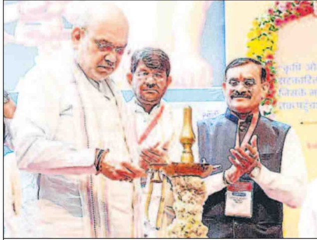
भोपाल में रविवार को सहकारिता सम्मेलन का उद्घाटन करते गृह मंत्री अमित शाह।

शाह ने भोपाल में राज्यस्तरीय सहकारी सम्मेलन में कहा कि पैक्स को जन औषधि केंद्र, जल वितरण, कॉमन सर्विस सेंटर जैसी सेवाएं प्रदान करने के लिए अनुमति दी गई है। पैक्स अब फर्टिलाइजर के डीलर बन सकते हैं और हर घर नल योजना का व्यवस्थापन भी कर सकते हैं। ढेर सारे पैक्स ने इन सेवाओं से आय प्राप्त की है। केंद्रीय मंत्री ने कहा कि आज 300 से ज्यादा योजनाएं पैक्स के कंप्यूटर पर लोगों के लिए उपलब्ध हैं। उन्होंने कहा कि इन संभावनाओं का पूरा दोहन करने के लिए बहुत काम किए जाने की जरूरत है। सहकारी आंदोलन देश में करीब-करीब खत्म हो गया था क्योंकि कानूनों में बदलाव नहीं किया गया।