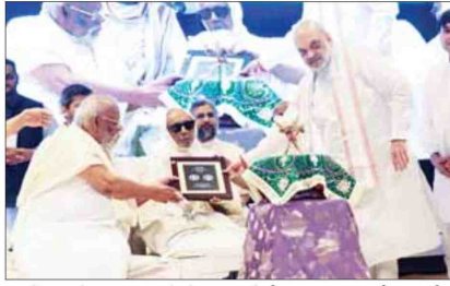
रविवार को अहमदाबाद में जैन आचार्या श्रीमद बुद्धसागर सूरि स्वारजी महाराज की 150वीं जयंती पर 150 रुपए का सिक्का जारी करते केन्द्रीय गृहमंत्री अमित शाह।

अहमदाबाद, (पंजाब केसरी): केंद्रीय सहकारिता मंत्री अमित शाह ने रविवार को कहा कि प्रधानमंत्री नरेंद्र मोदी के नेतृत्व में सहकारिता का भविष्य उज्ज्वल है और उनके मंत्रालय ने अपने गठन के बाद से 60 से अधिक पहल शुरू की हैं। शाह ने अहमदाबाद जिला सहकारी बैंक के स्वर्णिम शताब्दी समारोह को संबोधित करते हुए एडीसी को छोटे लोगों के लिए एक बड़ा बैंक बताया, जिसने पीढ़ियों से लाखों किसानों और पशुपालकों के जीवन में समृद्धि लाने का काम किया है। जब से (मोदी ने सहकारिता मंत्रालय की स्थापना की है) तब से इसने 60 से अधिक पहल की हैं। हमने पांच वर्षों में दो लाख प्राथमिक सहकारी समितियों का पंजीकरण सुनिश्चित किया है। इसमें सेवा सहकारी समितियाँ और प्राथमिक दूध उत्पादक सहकारी समितियाँ शामिल हैं, जो सहकारी आंदोलन की नींव हैं। प्रधानमंत्री मोदी के नेतृत्व में सहकारिता का भविष्य उज्ज्वल है। शाह ने कहा कि देश में एक भी पंचायत ऐसी नहीं होनी चाहिए, जिसमें प्राथमिक सेवा सहकारी समिति या प्राथमिक दूध उत्पादक समिति न हो। उन्होंने कहा कि