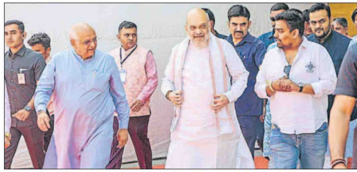
केंद्रीय गृह मंत्री अमित शाह रविवार को अहमदाबाद पहुंचे। इस दौरान गुजरात के मुख्यमंत्री भूपेंद्र पटेल भी मौजूद रहे।

शाह ने कहा कि देश में एक भी पंचायत ऐसी नहीं होनी चाहिए, जिसमें प्राथमिक सेवा सहकारी समिति या प्राथमिक दूध उत्पादक समिति न हो। उन्होंने कहा कि समितियों के संविधान में अनेक