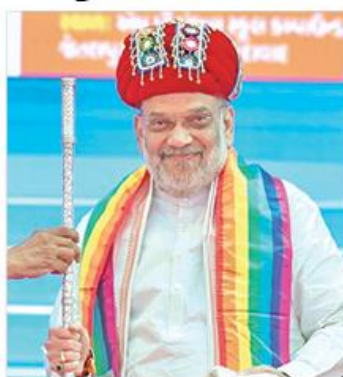
Union Home Minister Amit Shah during the closing ceremony of the 'Swarnim Shatabdi Mahotsav', in Gujarat on March 9, 2025.

"They can also build godowns and undertake water supply projects. Until the cooperative society is strong, the (cooperative) bank cannot be strong. And until the bank is strong, the dairy