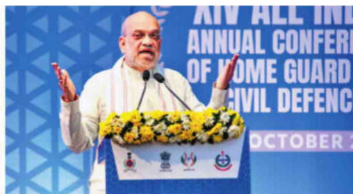
Home Minister Amit Shah at a conference in Gandhinagar on Tuesday

Out of 8 crore rural families engaged in dairy farming across the country, 6.5 crore remain outside the cooperative sector, said the Union Home Minister. As a result, these farmers are unable to receive the full value of their milk production. Shah urged the NDDB to take proactive steps to ensure these farmers are integrated into the cooperative sys-