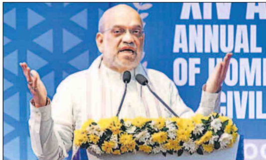
आणंद में मंगलवार को एक कार्यक्रम को संबोधित करते सहकारिता मंत्री अमित शाह।

शाह ने कहा, गरीब किसानों, खासकर डेयरी उद्योग से जुड़ी महिलाओं को सशक्त बनाने के लिए काम करते हुए पटेल ने खुद की परवाह नहीं की। वर्तमान में सहकारी क्रांति से महिला किसान सफलता हासिल कर रही हैं।