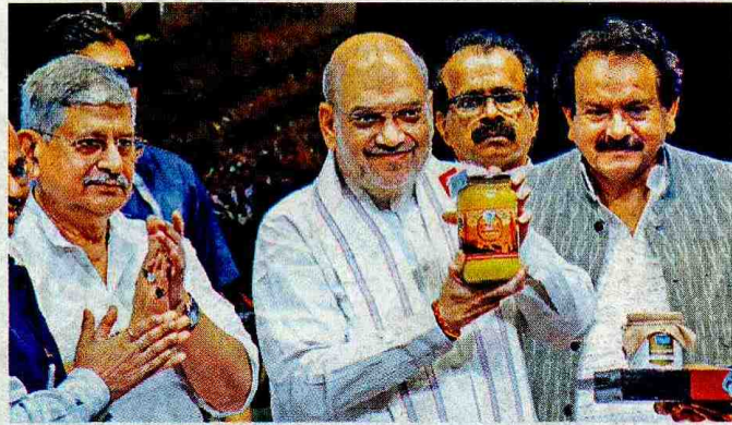
गुजरात के आणंद जिले में एनडीडीबी के हीरक जयंती वर्ष व अमूल कोआपरेटिव के संस्थापक त्रिभुवनदास पटेल के जयंती समारोह के दौरान केंद्रीय मंत्री अमित शाह

हमें अपना उत्पाद बेचने के लिए स्वयं को तैयार करना होगा : शाह ने कहा कि एनडीडीबी दुनिया का सबसे बड़ा सहकारी संस्थान है। हमें कारपोरेट कंपनियों के साथ प्रतिस्पर्धा करते हुए बाजार में अपना उत्पाद बेचने के लिए स्वयं को तैयार करना होगा। नागरिक सुरक्षा और होमगार्ड के