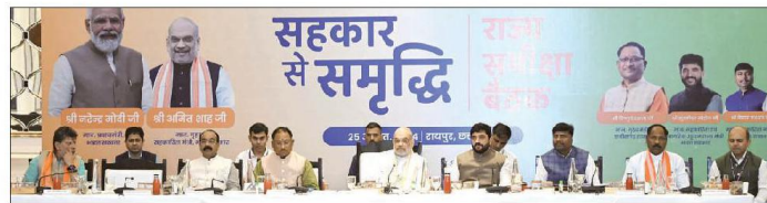
Union Home Minister Amit Shah along with Chief Minister Vishnu Deo Sai, Deputy Chief Minister Arun Sao, Union Minister of State for Cooperation Murlidhar Mohol, Chhattisgarh Co-operative Minister Kedar Kashyap and others during a meeting at Hotel MayFair Lake Resort in new capital city Nava Raipur Atal Nagar of Chhattisgarh on Sunday.

In his address at the Co-operative Review Meeting, Union Minister of Co-operation Shah