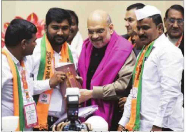
Union home minister Amit Shah being felicitated by farmers during the launch of a portal for them

In 2023, India imported close to 1.9 million tonne (MT) of tur and urad. The country's