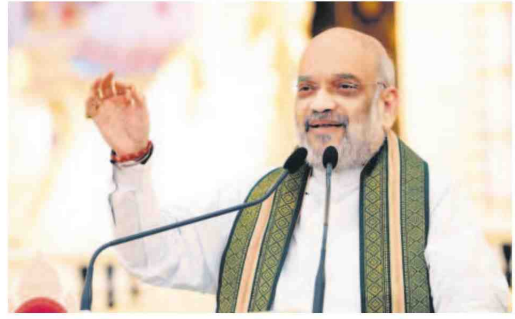
Union cooperation minister Amit Shah launched the portal through which farmers can register and sell their produce.

"Produce pulses and make the country self-reliant in this