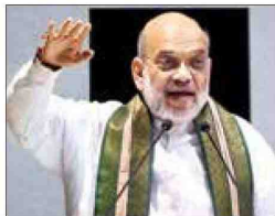
Union Cooperation Min Amit Shah

Shah said the projects will modernise and enhance the efficiency of the cooperative sector by bringing the entire cooperative ecosystem on a