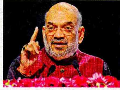
नई दिल्ली में मंगलवार को आयोजित कार्यक्रम को संबोधित करते केंद्रीय सहकारिता मंत्री अमित शाह

अमित शाह ने कहा कि डिजिटल माध्यम से सहकारिता भी गांवों तक पहुंचने लगी है। सहकारी समिति के रजिस्ट्रार कार्यालय एवं कृषि तथा ग्रामीण विकास बैंकों के कंप्यूटरीकरण के जरिये पैक्स के साथ पूरी सहकारिता व्यवस्था को आधुनिक बनाया जा रहा है।