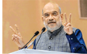
नई दिल्ली में पैक्स (प्राइमरी एग्रीकल्चरल क्रेडिट सोसाइटीज) द्वारा प्रधानमंत्री भारतीय जन-औषधि केंद्र के संचालन पर राष्ट्रीय सम्मेलन को संबोधित करते केंद्रीय गृह एवं सहकारिता मंत्री अमित शाह

इस दौरान स्वास्थ्य एवं परिवार कल्याण मंत्री मनसुख मांडविया एवं सहकारिता राज्य मंत्री बीएल वर्मा समेत कई लोग मौजूद थे। शाह ने कहा कि नौ वर्षों में जन औषधि केंद्रों के जरिये गरीबों को बहुत लाभ हुआ है। इससे लगभग 25 हजार करोड़ रुपये की बचत हुई है। इसका दायरा बढ़ाया जा रहा है। आज दस हजार