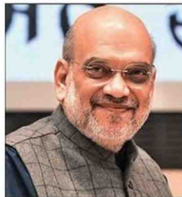
Amit Shah during the 'National PACS Mega Conclave' on Monday

The PMBJKs provide quality generic medicines