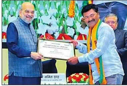
पैक्स के कार्यक्रम में लाभार्थी को प्रमाणपत्र सौंपते शाह।

राष्ट्रीय पैक्स मेगा कॉन्क्लेव में देश को विकसित बनाने के लक्ष्य का जिक्र करते हुए गृह मंत्री शाह ने कहा कि सहकारी समितियों की मदद से गरीब भी समृद्ध होंगे। उन्होंने सभी पैक्स से सरकार से जुड़े 22 विभिन्न कार्यों को अपनाने का आग्रह किया। पांच पैक्स को जन औषधि केंद्र स्टोर कोड प्रमाणपत्र देते हुए शाह ने कहा कि पैक्स अपने उपनियमों में किए गए बदलावों के चलते जन औषधि केंद्र खोलने के लिए अपनी व्यावसायिक गतिविधियों का विस्तार कर सकती हैं। शाह ने कहा, पिछले छह महीनों में पैक्स से 4,470 आवेदन प्राप्त हुए। इनमें से 2,373 पैक्स को सैद्धांतिक मंजूरी दे दी गई है। उनमें से लगभग 241 ने जन औषधि केंद्रों का संचालन शुरू कर दिया है। ग्रामीण इलाकों में ये आउटलेट खुलने से वहां के लोग अब किफायती दवाओं पर जेनेरिक दवाएं खरीद सकते हैं। उदाहरण के लिए, कैसर की दवाएं जिनकी कीमत खुले बाजार में लगभग 2,250 रुपये है, उन्हें 250 रुपये में बेचा जाता है। यहां तक कि