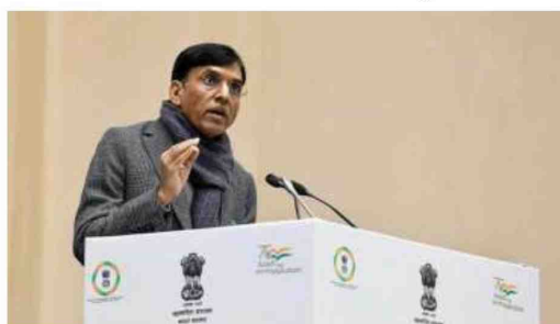
HEALTH FOR ALL. Union Health Minister Mansukh Mandaviya addresses the 'PACS as Pradhan Mantri Bharatiya Jan Aushadhi Kendra' conclave, in New Delhi, on Monday.

"In the first phase, 2,000 Jan Aushadhi Kendras are planned to be opened through PACS," said the Minister, adding that of the applications approved, 500 are already functional. Opening these Kendras through PACS "will strengthen PACS as a co-operative organisation, besides expanding the reach of quality and affordable medi-