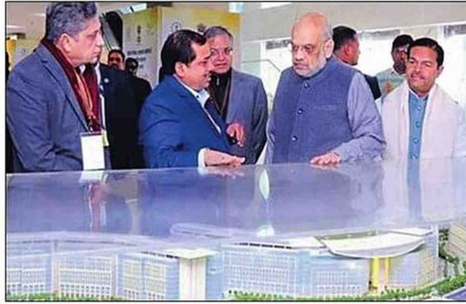
नई दिल्ली में सीआरसीएस के नए भवन के उद्घाटन के दौरान केंद्रीय मंत्री शाह।

शाह ने कहा, देश में लगभग 125 साल पुराना सहकारिता आंदोलन समय के साथ-साथ क्षीण हो गया था, कानून अप्रासंगिक हो गए थे। इस कारण आजादी के 75 वर्षों के बाद पीछे मुड़कर देखने पर लगा कि सहकारिता आंदोलन जितनी गति से आगे बढ़ना चाहिए था, उतनी तेजी से नहीं बढ़ा। पीएम मोदी की ओर से सहकारिता मंत्रालय की स्थापना के पीछे स्पष्ट उद्देश्य था कि ऊपर से नीचे तक पूरी सहकारिता का समय के साथ कदम मिलाना। सहकारिता मंत्रालय के गठन के दो सालों के बाद आज मल्टीस्टेट कोऑपरेटिव सोसायटी एक्ट में 98वें संशोधन के अनुसार सभी परिवर्तन कर दिए गए हैं। मोदी सरकार ने कोऑपरेटिव सोसायटी के संचालन में आने वाली कई प्रकार की विसंगतियों को दूर करने के लिए 2023 में कानून बनाकर पारदर्शी सहकारिता का एक मजबूत खाका तैयार करने का काम किया है।