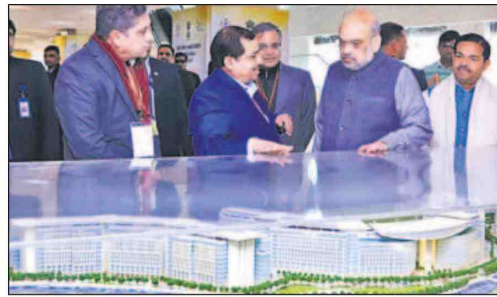
नई दिल्ली में बुधवार को सहकारी समितियों के केंद्रीय पंजीयक कार्यालय भवन के उद्घाटन कार्यक्रम में सहकारिता मंत्री अमित शाह।

शाह ने कहा, बहुराज्यीय सहकारी समितियों के लिए बनाए गए नए कानूनों को सभी ने लागू किया है। इस बात का सबसे बड़ा उदाहरण है कि कोऑपरेटिव सेक्टर खुद भी सुधारों का स्वागत करता है। उन्होंने कहा कि पांच लाख करोड़ डॉलर की भारतीय अर्थव्यवस्था में सहकारी समितियों की