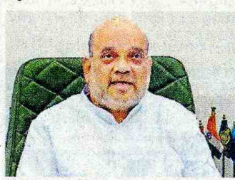
अमित शाह • फाइल फोटो

जागरण ब्यूरो, नई दिल्ली: केंद्रीय गृह एवं सहकारिता मंत्री अमित शाह ने कहा कि सहारा समूह की सहकारी समितियों के डेढ़ करोड़ निवेशकों का निबंधन हो चुका है। इनमें ढाई लाख लोगों के 241 करोड़ रुपये वापस भी मिल गए हैं। सहकारिता क्षेत्र में पारदर्शिता और आधुनिकता लाने का वादा करते हुए अमित शाह ने कहा कि मोदी सरकार में नए कानून, नए आफिस और नई पारदर्शी व्यवस्था के साथ सहकारिता क्षेत्र में नए युग की शुरुआत हुई है। अमित शाह बुधवार को नई दिल्ली में सहकारी समितियों के केंद्रीय पंजीयक कार्यालय (सीआरसीएस) के नए भवन का उद्घाटन कार्यक्रम को संबोधित कर रहे थे। शाह ने कहा कि यह क्षेत्र विश्वसनीयता खो देगा तो विस्तार तो होगा ही नहीं, अस्तित्व का संकट भी आ जाएगा। उन्होंने कहा, कि सहकारिता का ही चमत्कार है कि गुजरात में 36 लाख