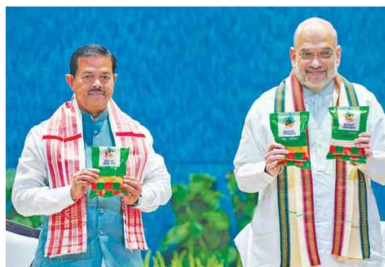
Union Home Minister and Minister of Cooperation Amit Shah, with Union Minister of State B. V. Verma, launches Bharat Organics products during the National Symposium on Promoting Organic Products through Cooperatives organised by National Cooperative Organics Limited (NCOL), in New Delhi on Wednesday

and related institutions across the country. It is hoped that with access to national and international markets under a strong brand, the members will get better returns for their organic produce. According to the data, the total size of the world organic food market in 2020 was around ₹10 lakh crore, of which India's organic product exports accounted for a meagre ₹7,000 crore. Currently, the certified Indian organic product retail sales market is around ₹27,000 crore, and it is expected to reach ₹1 lakh crore in the next five years. Therefore, the Government wants to ensure that the benefits of this growth reach farmers. Addressing the 'National Symposium on Promotion of Organic Products through Cooperatives' here, Shah said that under the 'Bharat Organics' brand, 20 more