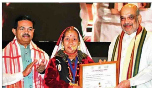
Shah hands over a membership certificate to a National Cooperative Organics Limited member during the National Symposium on 'Promoting Organic Products through Cooperatives' organised by NCOL in New Delhi on Wednesday

New Delhi: Union home and cooperation minister Amit Shah on Wednesday launched organic food products under the brand name 'Bharat Organics' of the newly-created National Cooperative Organics Ltd (NCOL) and asserted that it will not only be the country's "biggest undertaking" in the next five years but also emerge as the "most trusted and biggest brand" in the global organic product market in coming years.