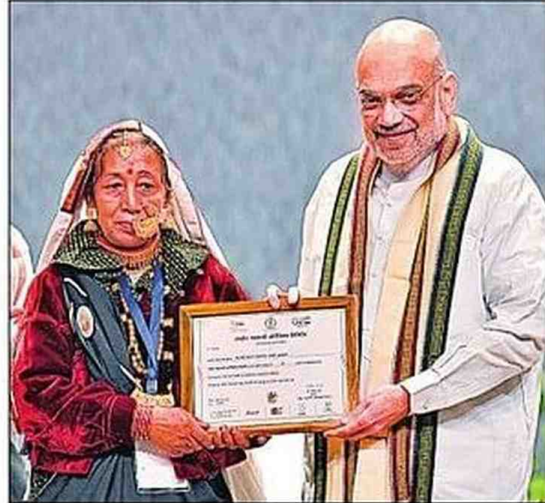
समिति सदस्यों को प्रमाणपत्र देते गृह मंत्री शाह।

शाह बुधवार को एनसीओएल के 'भारत ऑर्गेनिक्स' ब्रांड और उसके छह जैविक उत्पादों का लोकार्पण किया। साथ ही पांच सहकारी समितियों को एनसीओएल सदस्यता प्रमाणपत्र प्रदान किया। पूसा में आयोजित समारोह में शाह ने कहा कि एनसीओएल जैविक उत्पादकों के लिए एक मंच है। आज हम 'भारत ऑर्गेनिक्स' के तहत छह उत्पाद जारी कर रहे हैं और दिसंबर तक ऐसे 20 उत्पाद लाए जाएंगे। उन्होंने कहा कि छह जैविक उत्पाद अरहर दाल, चना दाल, चीनी, राजमा, बासमती चावल और सोना मसूरी चावल होंगे। मदर डेयरी की 150 सफल दुकानों और ऑनलाइन मंच के जरिये इनकी बिक्री की जाएगी।