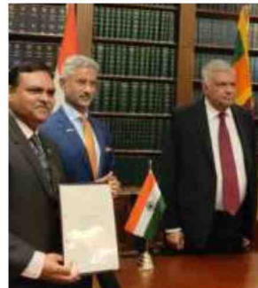
President of Sri Lanka Ranil Wikremesinghe with External Affairs Minister S Jaishankar