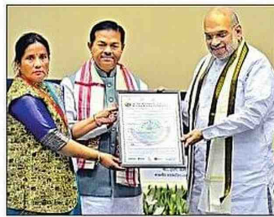
समिति सदस्यों को प्रमाण पत्र सौंपते शाह।

शाह भारतीय बीज सहकारी समिति लि. (बीबीएसएसएल) की तरफ से सहकारी क्षेत्र में उन्नत एवं पारंपरिक बीजोत्पादन विषय पर आयोजित कार्यक्रम को संबोधित कर रहे थे। उन्होंने कहा, भारत को वैश्विक बीज निर्यात के बजार में एक बड़ा हिस्सेदार बनाना एक समयबद्ध लक्ष्य होना चाहिए। आज देश के हर किसान को वैज्ञानिक रूप से तैयार किया गया