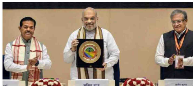
SOWING OPPORTUNITIES. Minister of Cooperation Amit Shah unveils the logo of Bharatiya Beej Sahakari Samiti Ltd with Union Minister of State for Cooperation BL Verma and Cooperation Secretary Gyanesh Kumar in New Delhi

The BBSSL has an authorised share capital of ₹500 crore and has been established with an initial paid-up share capital of ₹250 crore, shared equally by IFFCO, Kribhco, Nafed, National Co-operat-