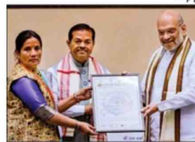
Amit Shah felicitates a woman of a Sahakari Samiti at the 'National Symposium on Production of Improved and Traditional Seeds through Cooperative Sector' in New Delhi on Thursday

The BBSSL, set up under Multi State Cooperative Societies Act 2022 through a cabinet decision taken in January, will act as an apex organisation for production, procurement, processing, branding, labelling, packaging, storage, marketing and distribution of