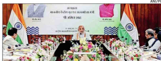
Union minister Amit Shah addresses the 89th general council meeting of the National Cooperative Development Corporation in New Delhi on Monday

He was addressing the 89th general council meeting of the National Cooperative Develop-