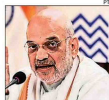
Amit Shah addresses 89th general council meeting of the NCDC in New Delhi on Monday

He said that NCDC should now set a target of achieving Rs 1 lakh crore yearly disbursement in next three years along with targets for every quarter. "NCDC's objective must not only be to make profit but to achieve overall development of the cooperative sector," he said. The initiatives taken by the Centre to strengthen cooperative movement have special focus on strengthening the Primary Agriculture Credit Societies (PACS). These initiatives include computerisation, making model byelaws, widening the functioning of PACS to undertake more than 30 busi-