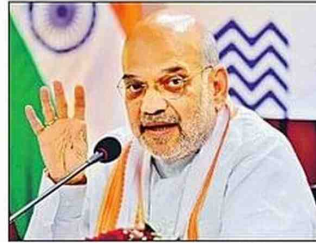
एनसीडीसी की 89वीं महापरिषद की बैठक को संबोधित करते गृह मंत्री अमित शाह।

केंद्रीय सहकारिता मंत्री ने कहा कि एनसीडीसी को प्रत्येक तिमाही के लक्ष्यों के साथ-साथ अगले 3 वर्षों में 1 लाख करोड़ रुपये का वार्षिक वितरण लक्ष्य निर्धारित करना चाहिए। उसे कम दरों पर कर्ज लेने के जरिये ढूँढ़ने चाहिए और ब्याज दर कम रखते हुए सहकारिता क्षेत्र को ऋण देना चाहिए। उन्होंने कहा कि एनसीडीसी का उद्देश्य केवल लाभ कमाना नहीं बल्कि सहकारिता क्षेत्र के समग्र विकास का होना चाहिए। शाह ने कहा कि देश के 60 करोड़