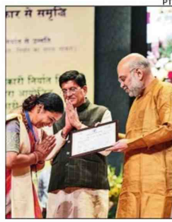
The home minister launched the logo, website and brochure of the cooperative export body

Addressing a national symposium on cooperative exports, Shah said the NCEL, which would help cooperative societies tap the global export market and handhold them to produce and manufacture products that comply with international standards, is also negotiating orders worth Rs 15,000 crore.