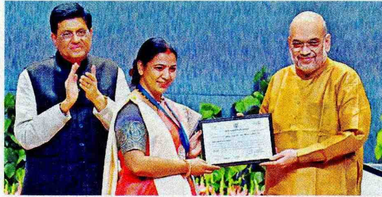
गृह एवं सहकारिता मंत्री अमित शाह ने नई दिल्ली के पूसा में 'सहकारी निर्यात पर संगोष्ठी' में महिला सदस्य को सम्मानित किया। वाणिज्य मंत्री पीयूष गोयल भी मौजूद रहे

एनसीईएल के गठन का उद्देश्य बताते हुए शाह ने कहा कि निर्यात, किसान की समृद्धि, फसल पैटर्न बदलने, जैविक उत्पादों एवं बायोफ्यूल के लिए वैश्विक बाजार में भारत का प्रवेश और सहकारिता को मजबूत करना है। अब तक 1500 सहकारी संस्थाएं एनसीईएल की सदस्य बन चुकी हैं और आगे तहसील स्तर तक इसकी पहुंच होगी। किसान से न्यूनतम समर्थन मूल्य पर खरीद की जाएगी और छह माह की बैलेंसशीट बनने के बाद मुनाफे का 50 प्रतिशत सीधा किसान के बैंक खाते में जाएगा। आने वाले दिनों में इसके माध्यम से * खरीद, भंडारण, प्रसंस्करण,