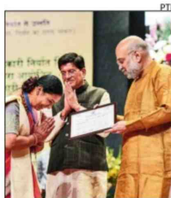
The home minister launched the logo, website and brochure of the cooperative export body

Addressing a national symposium on cooperative exports, Shah said the NCEL, which would help cooperative societies tap the global export market and handhold them to produce and manufacture products that comply with international standards, is also negotiating orders