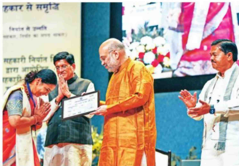
Union Home Minister and Minister of Cooperation Amit Shah distributes membership certificates to National Cooperative Exports Limited members in New Delhi on Monday. Union Ministers Piyush Goyal and B L Verma are also seen on stage.

Farmers will get 50% of profit through coop export body: Shah