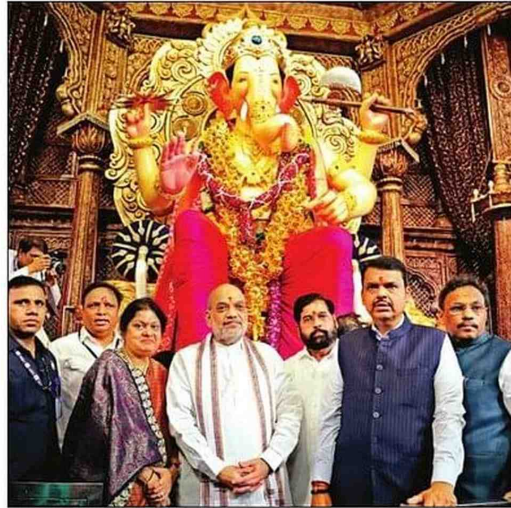
लालबागचा राजा के दर्शन... कार्यक्रम में शिरकत करने से पहले गृह मंत्री अमित शाह ने मुख्यमंत्री एकनाथ शिंदे और उपमुख्यमंत्री देवेंद्र फडणवीस के साथ मुंबई के प्रसिद्ध गणेश प्रतिमा लालबागचा राजा के दर्शन किए।

न इनके जीवन में सुरक्षा थी, न स्थिरता और न स्वयं। मोदी ने 9 साल में 60 करोड़ लोगों को बैंक खाता खुलवाया। उन्हें आवास दिया। पानी, बिजली, गैस और शौचालय के अलावा हर व्यक्ति को 5 किलो अनाज मुफ्त देकर उनको खाने की चिंता से मुक्त कर