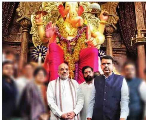
Amit Shah with Maharashtra CM Eknath Shinde and deputy CM Devendra Fadnavis at the Lalbaughcha Raja Ganesh pandal on Saturday

Shah assumed charge as the first cooperation minister in 2019. Cooperative movement is the only economic model where "the smallest of