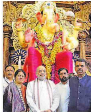
Union home minister Amit Shah visits Lalbaugcha Raja in Mumbai on Saturday.

The proposed cooperative sector-dedicated university, which is still in works, Shah said, would strengthen the sector by providing skilled manpower. The lecture was organised by Mumbai Univer-