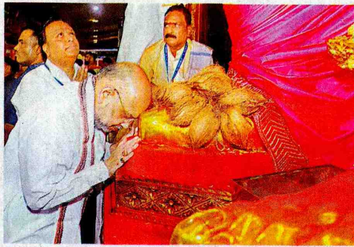
मुंबई में शनिवार को केंद्रीय गृह मंत्री अमित शाह गणेशोत्सव के दौरान लालबाग के राजा के दरबार पहुंचे एवं गणपति बप्पा का दर्शन-पूजन किया

शाह ने कहा, सहकारिता के जरिये 'मास प्रोडक्शन' (शेक उत्पादन) करके राष्ट्र का एवं 'प्रोडक्शन बाई