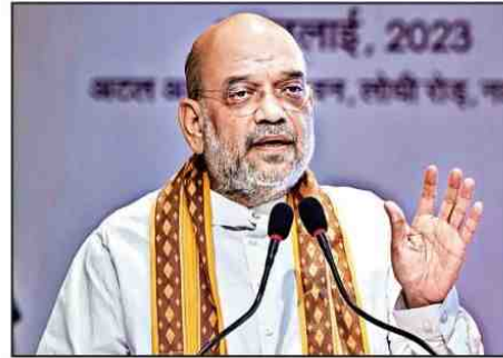
शाह ने पोर्टल की शुरुआत की।

सहारा इंडिया की चार कोऑपरेटिव सोसाइटी में निवेश करने वाले 10 करोड़ लोगों का फंसा पैसा वापस मिलेगा। केंद्रीय मंत्री अमित शाह ने सीआरसीएस-सहारा रिफंड पोर्टल की शुरुआत की। इस पोर्टल का मकसद लोगों का पैसा 45 दिनों में वापस करना है। पोर्टल के जरिए सहारा की चार को-ऑपरेटिव सोसाइटी के निवेशक ही आवेदन कर सकते हैं। ये हैं, सहारा क्रेडिट कोऑपरेटिव सोसाइटी लिमिटेड लखनऊ, सहारायन यूनिवर्सल मल्टीपर्पज सोसाइटी लिमिटेड भोपाल, हमारा इंडिया क्रेडिट कोऑपरेटिव सोसाइटी लिमिटेड कोलकाता, स्टार्स मल्टीपर्पज कोऑपरेटिव सोसाइटी लिमिटेड हैदराबाद। निवेशकों में बिहार, झारखंड, उत्तर प्रदेश, मध्य प्रदेश जैसे राज्यों के लोगों की संख्या सबसे ज्यादा है। शुरुआत में जमाकर्ताओं को 10,000 रुपये तक का रिफंड मिलेगा।