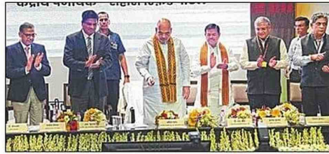
नई दिल्ली में रिफंड पोर्टल की शुरुआत करते केंद्रीय सहकारिता मंत्री अमित शाह।

नई दिल्ली। सहारा समूह की चार सहकारी समितियों में 10 करोड़ जमाकर्ताओं का फंसा पैसा वापस मिलेगा। केंद्रीय गृह एवं सहकारिता मंत्री अमित शाह ने मंगलवार को सीआरसीएस सहारा रिफंड पोर्टल की शुरुआत की। पहले चरण में 1.7 करोड़ जमाकर्ताओं का पैसा लौटाया जाएगा। पोर्टल पर पंजीकरण के 45 दिनों के अंदर रिफंड खाते में पहुंच जाएगा। दावे के लिए कोई फीस नहीं देनी होगी। केंद्रीय मंत्री शाह ने इसे ऐतिहासिक कदम बताते हुए कहा, यह पहली बार है, जब जमाकर्ताओं को ऐसे मामले में रिफंड मिल रहा है, जहां कई सरकारी एजेंसियां शामिल हैं और इनमें से प्रत्येक ने जल्दी की है। उन्होंने बताया कि पोर्टल के माध्यम से प्रत्येक निवेशक को पहले दस हजार रुपये मिलेंगे। ज्यादा निवेश