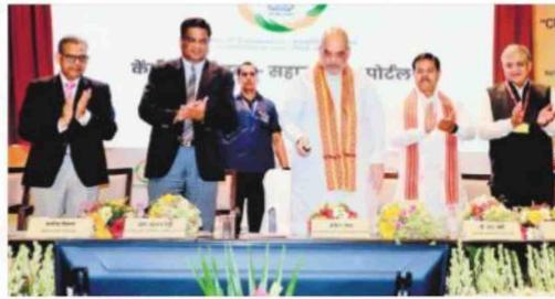
Home Minister Amit Shah launches the CRCS-Sahara Refund Portal | EXPRESS

He said the "process of returning the amount of ₹5,000