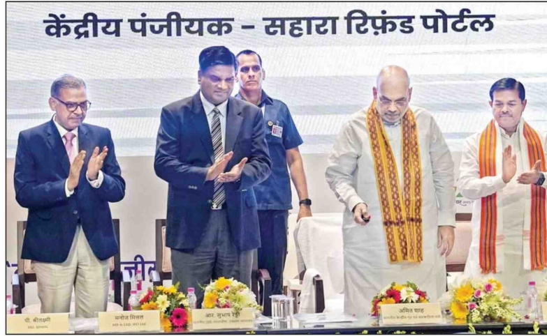
नई दिल्ली में मंगलवार को 'सीआरसीएस-सहारा रिफंड पोर्टल' लॉन्च करते केन्द्रीय गृह एवं सहकारिता मंत्री अमित शाह।

केन्द्रीय सहकारिता मंत्रालय ने सुप्रीम कोर्ट में आवेदन किया था जिस पर सुप्रीम कोर्ट ने जमाकर्ताओं के बकाया भुगतान के लिए सहारा-सेबी खाते में सहारा द्वारा जमा किए गए 25 हजार करोड़ रुपए में से पांच हजार करोड़ रुपए को सेंट्रल रजिस्ट्रार ऑफ को-ऑपरेटिव सोसाइटीज को ट्रांसफर करने के आदेश दिए थे।