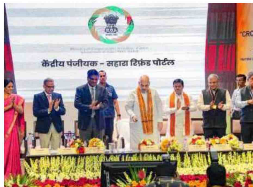
New start: Amit Shah launching the 'CRCS- Sahara Refund Portal' in New Delhi on Tuesday.

The four cooperative societies Sahara Credit Coop-