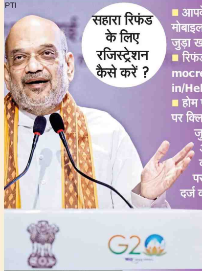
सहकारिता मंत्री अमित शाह

सहकारिता मंत्री अमित शाह ने इसके लिए मंगलवार को सहारा रिफंड पोर्टल' लॉन्च किया। निवेशकों को अब अपने पैसे वापस लेने के लिए इस पोर्टल पर रजिस्ट्रेशन करना पड़ेगा और संबंधित दस्तावेज अपलोड करने होंगे। कुछ बातों का पालन करना होगा, तभी उन्हें रिफंड मिलेगा। (विस)