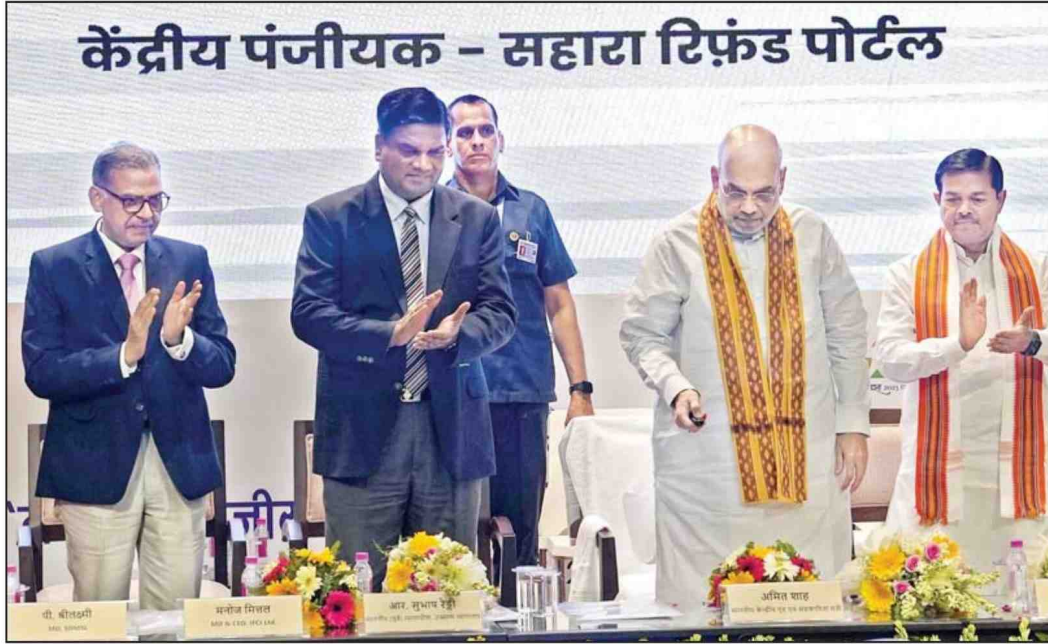
नई दिल्ली में मंगलवार को 'सीआरसीएस-सहारा रिफंड पोर्टल' लॉन्च करते केंद्रीय गृह एवं सहकारिता मंत्री अमित शाह।