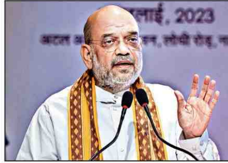
शाह ने पोर्टल की शुरुआत की।

सहारा इंडिया की चार कोऑपरेटिव सोसायटी में निवेश करने वाले 10 करोड़ लोगों का फंसा पैसा वापस मिलेगा। केंद्रीय मंत्री अमित शाह ने सीआरसीएस-सहारा रिफंड पोर्टल की शुरुआत की। इस पोर्टल का मकसद लोगों का पैसा 45 दिनों में वापस करना है। पोर्टल के जरिए सहारा की चार को-ऑपरेटिव सोसाइटी के निवेशक ही आवेदन कर सकते हैं। ये हैं, सहारा क्रेडिट कोऑपरेटिव सोसाइटी लिमिटेड लखनऊ, सहारायन यूनिवर्सल मल्टीपर्सन सोसाइटी लिमिटेड भोपाल, हमारा इंडिया क्रेडिट कोऑपरेटिव सोसाइटी लिमिटेड कोलकाता, स्टार्स मल्टीपर्सन कोऑपरेटिव सोसाइटी लिमिटेड हैदराबाद। निवेशकों में बिहार, झारखंड, उत्तर प्रदेश, मध्य प्रदेश जैसे राज्यों के लोगों की संख्या सबसे ज्यादा है। शुरुआत में जमाकर्ताओं को 10,000 रुपये तक का रिफंड मिलेगा। ▶▶ पेज 8