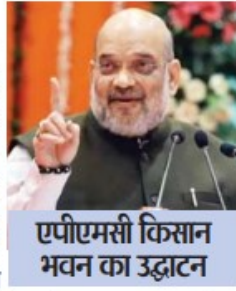
एपीएमसी किसान भवन का उद्घाटन

केन्द्रीय गृहमंत्री अमित शाह ने रविवार को गुजरात के जूनागढ़ में जिला बैंक मुख्यालय का शिलान्यास और कृषि शिविर में एपएमसी किसान भवन का उद्घाटन किया। शाह ने अपने संबोधन में इस अवसर पर कहा कि कई उतार-चढ़ाव के बाद जूनागढ़ जिला सहकारी बैंक का यह वर्तमान स्वरूप सामने आया है। जो किसान प्राकृतिक खेती में लगे हैं, उन्हें अपनी पैदावार के अच्छे दाम मिलेंगे। देश आज़ाद होने के बाद से लगातार अलग सहकारिता मंत्रालय की मांग उठती रही और प्रधानमंत्री नरेन्द्र मोदी ने देश के सहकारिता क्षेत्र से जुड़े लोगों की इस मांग को पूरा करते हुए सहकारिता मंत्रालय का गठन किया। केन्द्रीय मंत्री ने कहा, सहकारिता मंत्रालय के गठन के बाद मोदी ने सहकारिता को आगे बढ़ाने के लिए कई महत्वपूर्ण निर्णय लिए हैं। प्राकृतिक खेती आने वाले दिनों में धरती माता की सेवा करने का एकमात्र विकल्प बचेगा क्योंकि लगातार डीएपी और यूरिया का उपयोग होने से 25 सालों बाद यह धरती कंक्रीट जैसी हो जाएगी। केंचुए जैसे पॉजिटिव बैक्टीरिया को डीएपी और यूरिया खत्म कर देते हैं और जिनके खेत में पॉजिटिव बैक्टीरिया