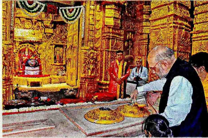
केंद्रीय गृह मंत्री अमित शाह ने रविवार को गिर सोमनाथ में अपने स्वजन के साथ रविवार को सोमनाथ मंदिर में पूजा-अर्चना की

● कहा- सहकारी समितियां किसानों की आय वृद्धि करने में मदद करेंगी