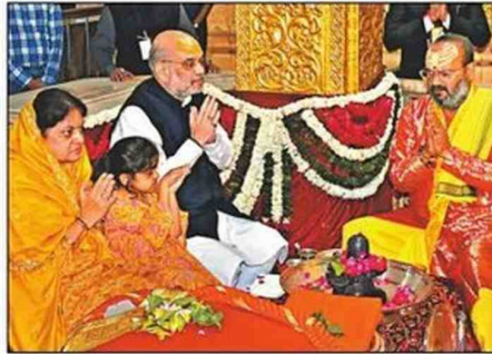
सोमनाथ मंदिर में परिवार के साथ पूजन करते शाह।

शाह ने कहा कि इससे मिट्टी और पर्यावरण को भी रसायनिक खद से होने वाले नुकसान से बचाया जा सकेगा। उन्होंने कहा, मैं आपको विश्वास दिलाता हूं कि पीएम मोदी के शुरू किए गए काम अगले 10 वर्षों में किसानों की आय को न केवल दोगुना, बल्कि कई गुना बढ़ाएंगे। शाह ने कहा कि प्रधानमंत्री मोदी ने कैबिनेट में तीन बहुराज्य सहकारी समितियों की स्थापना का अहम फैसला किया, जिनमें से दो समितियां राज्य के किसानों के लिए बहुत उपयोगी हैं। उन्होंने कहा, एक सहकारी समिति, किसानों से खरीदे गए जैविक उत्पादों