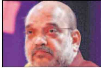
■ शाह ने कृषि बाजार समिति भवन का उद्घाटन किया

कृषि उपज बाजार समिति (एपीएमसी) के किसान भवन का उद्घाटन करने पहुंचे शाह ने किसानों द्वारा प्राकृतिक खेती अपनाने की भी जोरदार वकालत की। उन्होंने कहा कि इससे उनकी आय बढ़ाने में मदद मिलेगी तथा मिट्टी और पर्यावरण को भी रासायनिक खाद से होने वाले नुकसान