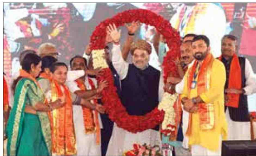
Union Minister of Home Affairs Amit Shah being garlanded during the foundation stone laying ceremony of Junagadh District Cooperative Bank Headquarters, in Junagadh, on Sunday

"I assure you that the work started by (Prime Minister Narendra) Modi saheb will not just double but increase the income