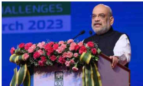
Minister for Home and Co-operation Amit Shah addressing the Indian Dairy Association's 49 th dairy industry conference

processing capacity is around 126 million litres per day, highest in the world. About 22 per cent of the total milk produced goes for processing. Whatever milk is processed and exported, will help increase farmers' incomes. There is an immense potential in dairy products exports such as milk powder, butter and ghee. We have created a multi-state co-operative society for exports. Once the integration of 2