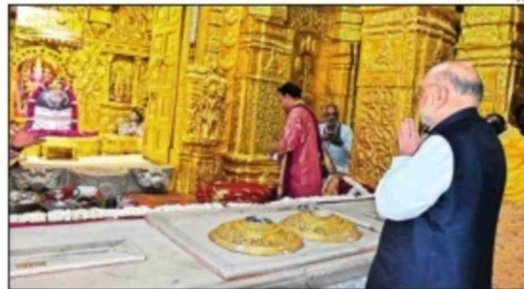
Amit Shah offers prayers at Somnath temple on Sunday

He said that PM Modi made an important decision in the cabinet to set up three multi-state cooperative societies, of which two are very useful for the state's farmers. "One will transfer the profits to the farmers directly for the organic produce procured from them," Shah said. Another cooperative society will help the farmers export