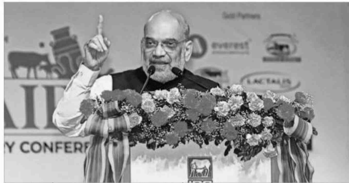
49वें डेयरी उद्योग सम्मेलन को संबोधित करते केंद्रीय सहकारिता और गृह मंत्री अमित शाह

शाह ने कहा कि हमें 2033-34 तक वैश्विक दुग्ध उत्पादन में 33 फीसद यानी 33 करोड़ मीट्रिक टन का योगदान देने के लक्ष्य के साथ आगे बढ़ना चाहिए। अगर (पंचायत स्तर पर) दो लाख नई दुग्ध उत्पादक समितियां बनाई जाती हैं, तो आने वाले सालों