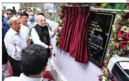
FREE FOOD CENTRE FOR PATIENTS' RELATIVES LAUNCHED: Union home minister Amit Shah on Saturday launched a free food centre for relatives of patients at Gandhinagar Civil Hospital. The facility, launched by Tulsi Vallabh Nidhi, will provide lunch and dinner, hospital officials said. State health minister Rushikesh Patel, ACS (health) Manoj Aggarwal and Gandhinagar MLA Rita Patel were present on the occasion