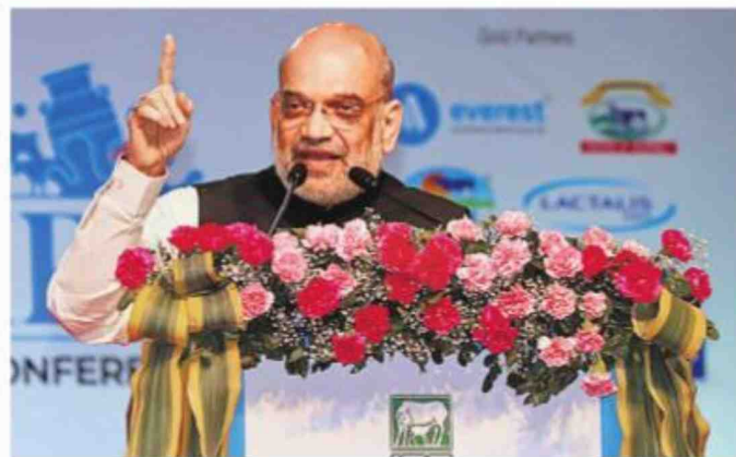
Amit Shah at 49th Dairy Industry Conference in Gandhinagar on Saturday

In his speech, Amit Shah stated that dairy is a global business, but in a country like India, with a population of 130 crores, it is a source of employment, an alternative to strengthening the rural economy, a solution to malnutrition problems, and a sector with enormous potential for women empowerment.