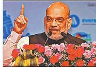
गांधीनगर में डेयरी उद्योग सम्मेलन को संबोधित करते सहकारिता मंत्री शाह।

केंद्रीय मंत्री गांधीनगर में इंडियन डेयरी एसोसिएशन (आईडीए) के डेयरी उद्योग सम्मेलन के तीसरे और अंतिम दिन बोल रहे थे। शाह ने कहा, यदि दो लाख नई प्राथमिक दुग्ध उत्पादक समितियां (पंचायत स्तर पर) बनाई जाती हैं, तो आने वाले वर्षों में भारत के पास वैश्विक दुग्ध उत्पादन में 33 फीसदी का योगदान करने की क्षमता होगी। शाह ने कहा, हमारी दूध प्रसंस्करण क्षमता लगभग 126 मिलियन लीटर प्रतिदिन है, जो दुनिया में सबसे अधिक है।