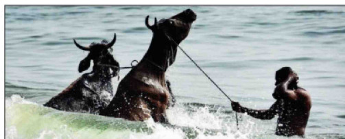
New dairy-fishery cooperatives will also be set up in the villages which currently don't have such societies

by Nabard through 352 district central cooperative banks (DCCBs) and 34 state cooperative banks (SCBs).