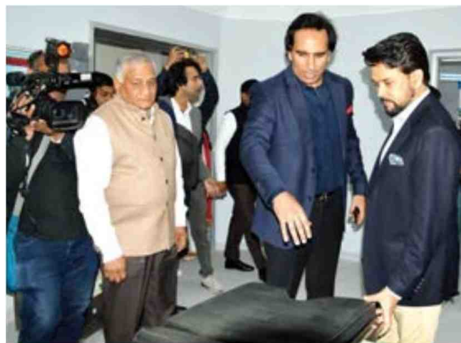
Union ministers Anurag Thakur and MoS V.K. Singh at a hospital in Ghaziabad on Wednesday.

The plan will be implemented with the convergence of various