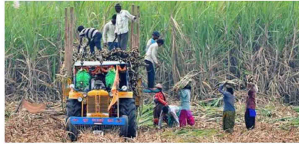
AWAITING COVERAGE. There are 1.6 lakh panchayats without a primary agricultural co-operative society and nearly 2 lakh without any dairy co-operative society. RAJIV SHARMA

The Cabinet decision would help in providing farmer members with requisite forward and backward linkages to market their produce, enhance their income, and obtain credit facilities and other services at the village level itself. Primary co-operative societies that cannot be revived will be identified for winding up, and