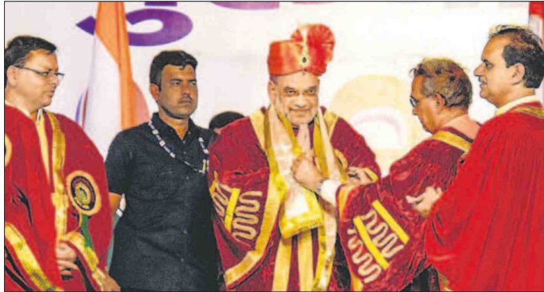
हरिद्वार में गुरुवार को गुरुकुल कांगड़ी विश्वविद्यालय में केंद्रीय गृहमंत्री अमित शाह को विद्या मार्तण्ड उपाधि से नवाजा गया।

इससे पहले शाह ने सहकारिता क्षेत्र की उपलब्धियां गिनाते हुए कहा कि देश में नई सहकारिता नीति बनाई गई है। किसानों के उत्पाद के निर्यात, जैविक खेती और बीजों के उत्पादन के लिए मल्टी-स्टेट को-ऑपरेटिव संस्थाएं बना दी गई हैं। सहकारिता क्षेत्र को कम भूमि वाले किसानों के लिए उपयोगी बनाकर आय दोगुनी की जा रही है।