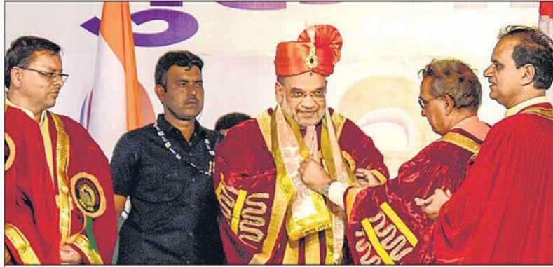
हरिद्वार में गुरुवार को गुरुकुल कांगड़ी विश्वविद्यालय में केंद्रीय गृहमंत्री अमित शाह को विद्या मार्तण्ड उपाधि से नवाजा गया।

इससे पहले शाह ने सहकारिता क्षेत्र की उपलब्धियां गिनाते हुए कहा कि देश में नई सहकारिता नीति बनाई गई है। किसानों के उत्पाद के निर्यात, जैविक खेती व बीजों के उत्पादन के लिए मल्टी-स्टेट को-ऑपरेटिव संस्थाएं बना दी गई हैं। सहकारिता क्षेत्र को किसानों के लिए उपयोगी बना आर्य दुगुनी की जा रही है।