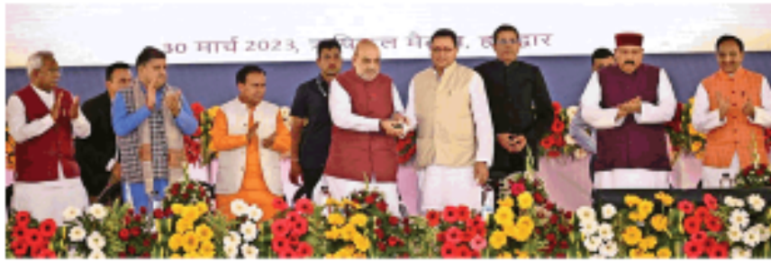
यूट्रेनीय सहकारी समितियों के कंप्यूटीकरण का बटन दबाकर शुभारंभ करते हुए मंत्री अमित शाह व मुख्यमंत्री पुष्कर सिंह धामी • जगज्ज