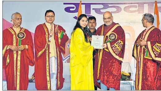
हरिद्वार में गुरुवार को गुरुकुल कांगड़ी विश्वविद्यालय के दीक्षांत समारोह में छात्रा को गोल्ड मेडल और डिग्री प्रदान करते गृह मंत्री अमित शाह। साथ में मौजूद उत्तराखंड के मुख्यमंत्री पुष्कर सिंह धामी।

गुरुवार को त्रिभुक्तल मैदान में गृह मंत्री अमित शाह ने 95 संयुक्त सहकारी खेती, 95 जन सुविधा केंद्र, 95 जन औषधि केंद्र और राज्य की समस्त बहुउद्देश्यीय साधन सहकारी समितियों (एम पैक्स) में पूर्ण रूप से कंप्यूटरीकरण का शुभारंभ किया। इस दौरान गृह मंत्री ने कहा कि प्रधानमंत्री नरेंद्र मोदी के नेतृत्व में पहली बार अलग सहकारिता मंत्रालय बनाया गया है।